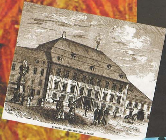
MUSEUL' LES BRUCKENTHAL EN BANIE.